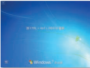
开机启动，显示等待界面。

只允许拥有已注册IC卡的用户登录PC，避免了ID、密码被盗用的风险。登录时将IC卡放在读卡器上，移开IC卡时PC即被锁定。在共用PC上，也可以通过IC卡来识别用户，进行个人认证。