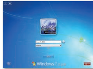
将IC卡放入读卡器，在所显示的登录界面输入密码。