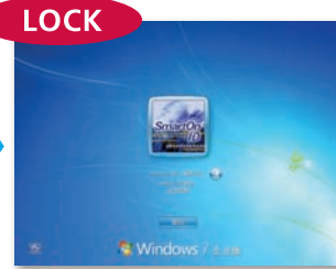
移开IC卡时，PC即被锁定。