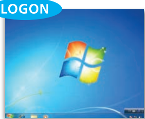
密码认证成功后登录Windows。